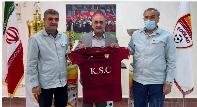
فرهنگ ورزش و پهلوانی ایفا کند. تیم فوتبال فولاد خوزستان در لیگ برتر دارد، با ساخت ورزشگاه پیشرفته شهدای فولاد خوزستان نقش مهمی در ترویج