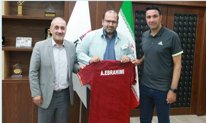
مجزو تیم حرفه‌ای از کنفدراسیون فوتبال آسیا، آکادمی فوتبال، تیم‌داری در رده‌های مختلف سنی و قرار گرفتن در میان تیم‌های صدر جدول بخش