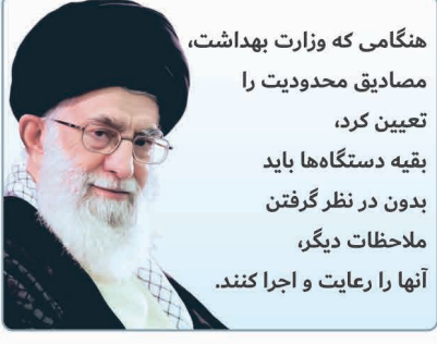
هنگامی که وزارت بهداشت، مصادیق محدودیت را تعیین کرد، بقیه دستگاه ها باید بدون در نظر گرفتن ملاحظات دیگر، آنها را رعایت و اجرا کنند.

یکشنبه ۱۷ بهمن ماه ۱۴۰۰ | ۴ رجب ۱۴۴۳ | ۶ فوریه ۲۰۲۲ | شماره ۲۰۷