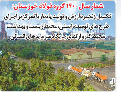
شعار سال ۱۴۰۰ گروه فولاد خوزستان: تکمیل زنجیره ارزش و تولید پایدار با تمرکز بر اجرای طرح های توسعه ای، منطبق با سیاست و بهداشت محیط کار و ارتقای جایگاه سرمایه های انسانی