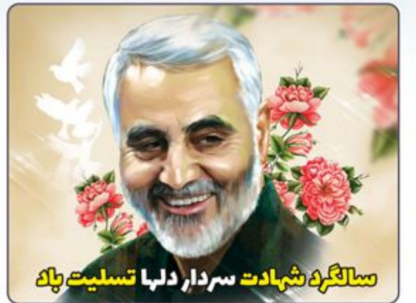
سالگرد شهادت سردار دلبا تسلیت باد